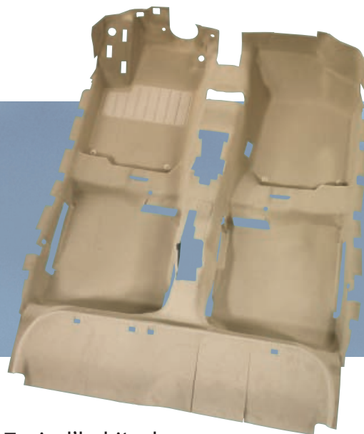
2. Tapis d'habitacle