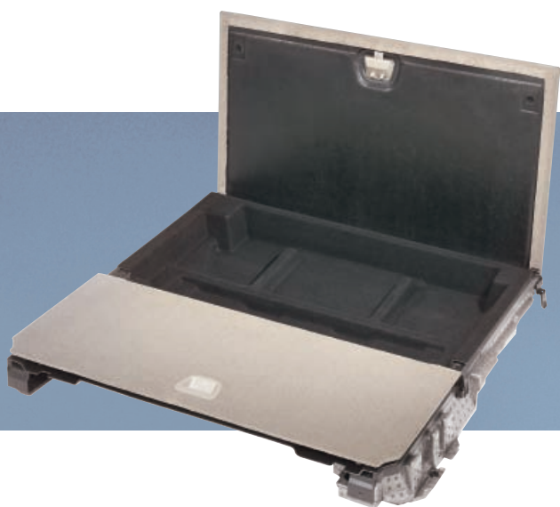
1. Bac de rangement