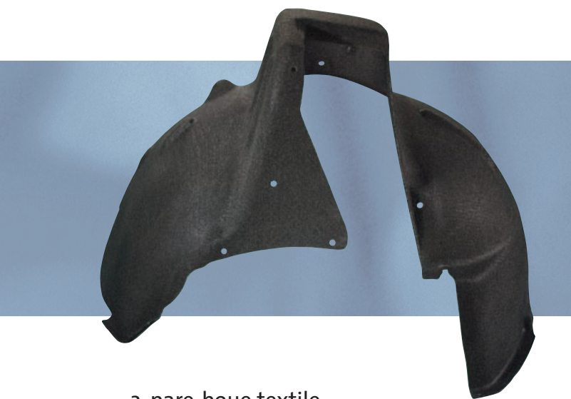
3. pare-boue textile

A l'intérieur d'un tapis d'habitacle, les masses lourdes ont été remplacées par du Propylat ® et ont permis, au travers de propositions acoustiques améliorées, une réduction de près de 2,4 kilos par m 2 . Le Propylat ® est composé à 90 % de fibres recyclées synthétiques et naturelles. Ces fibres souples thermo-plastiques, composées de Propylène simplifient l'ensemble du process de fabrication et optimisent également les capacités de recyclage.